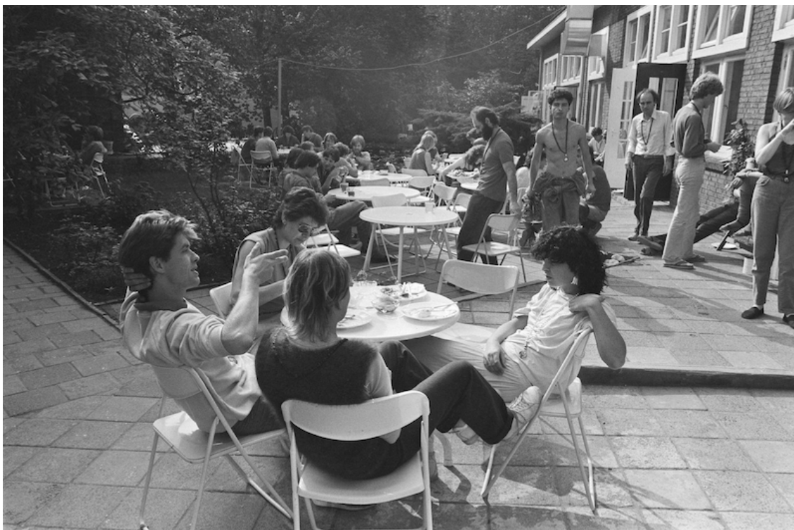
Stad Rajneesh Amsterdam

In de gevangenis woonden de mensen in een cel, met vier personen in één cel. Echt krap. Maar in deze commune had iedereen wat meer ruimte. Het was een geweldige plek om te wonen en te zijn. We hadden ook een prachtige binnentuin. Het lag in een hele populaire buurt die De Pijp heette. Ik denk dat er zo'n 100 of zelfs 200 mensen woonden.