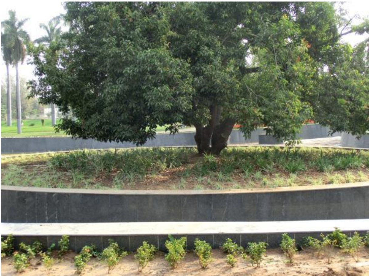
De maulshreeboom in het 'Bhawar Tal' in Jabalpur, waaronder Osho verlicht wordt.

Op het moment van zijn verlichting stond de hele boom in bloei. De boom is tot op heden ook altijd groen gebleven. Anadi weet dat de boom nu in zijn laatste fase zit voordat hij zal sterven. Het park wordt opgeknapt. Dat betekent dat er door het hele park kanaaltjes worden aangelegd. Wij kunnen nu nog bij de boom komen, maar over enige tijd kan dat niet meer. De boom wordt dan helemaal door water omgeven. Onder de boom zijn allemaal laagblijvende plantjes aangebracht. Ook dat maakt dat je er over enige tijd helemaal niet meer bij kan. In ons geval knijpt de bewaking een oogje toe en met hun hulp kunnen we onder de boom gaan zitten en staan ze ons toe daar te mediteren. Eén van ons heeft er een bijzondere ervaring. Ze voelt kanalen in haar rug opengaan en voelt zich ineens heel soepel. Ik voel onder de boom ineens liefde over me heen komen.