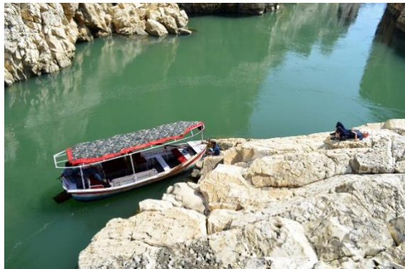
Tussen de marmeren rotsen doorvaren in Bhedaghat.

Anadi vertelt dat het gebied met de marmeren rotsen wel twee tot drie kilometer lang is. Wij zien maar een klein deel. Het water is er driehonderd meter diep. In zeldzame periodes van vloed stijgt het water tot boven de rotsen en zijn ze niet meer te zien. Nu is het waterpeil wat gezakt. Er is een lijn op de rotsen te zien die ongeveer een meter boven de waterspiegel staat.