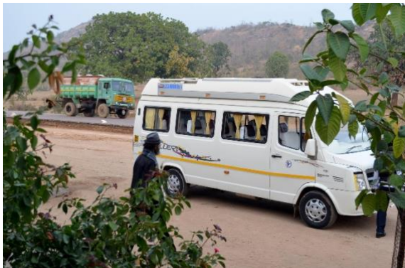
Onze privébus tijdens de reis.