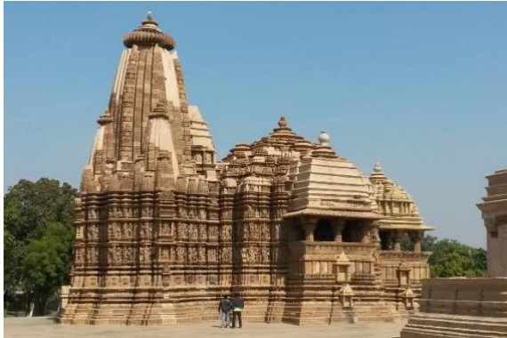
De Jagadambi tempel met de lagen van onwetendheid, de blokkades op weg naar verlichting.

tantra met behulp van meditatietechnieken om aan de mind voorbij te gaan. Gorakh experimenteerde met technieken die hun oorsprong vinden in de vijfduizend jaar oude geschriften Vigyan Bhairav Tantra van Shiva. Lang zijn de honderdtwaalf meditatietechnieken uit de oude geschriften onbekend gebleven. Osho geeft ons Het Boek der Geheimen , waarin hij deze technieken beschrijft en diepgaand toelicht. Zo kwamen ze voor de wereld beschikbaar.