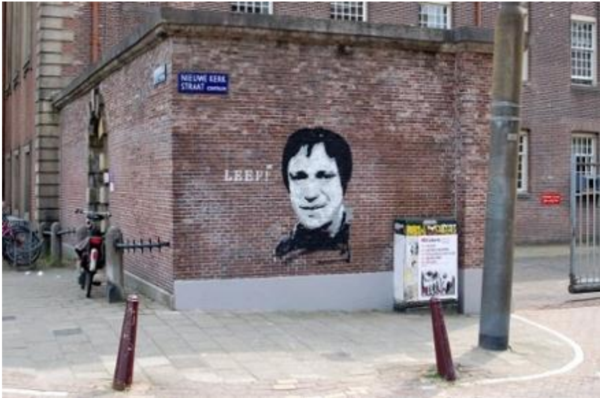
Ramses leeft voort in de Nieuwe Kerkstraat...