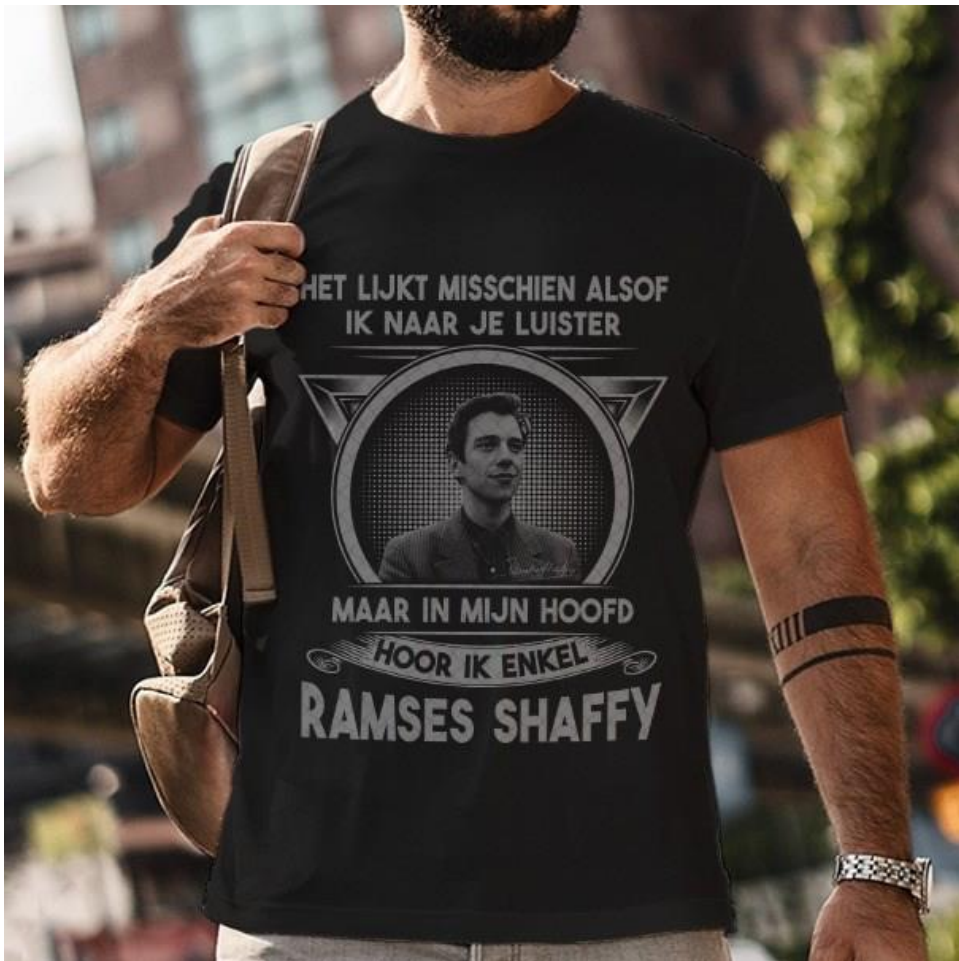
... op T-shirts...