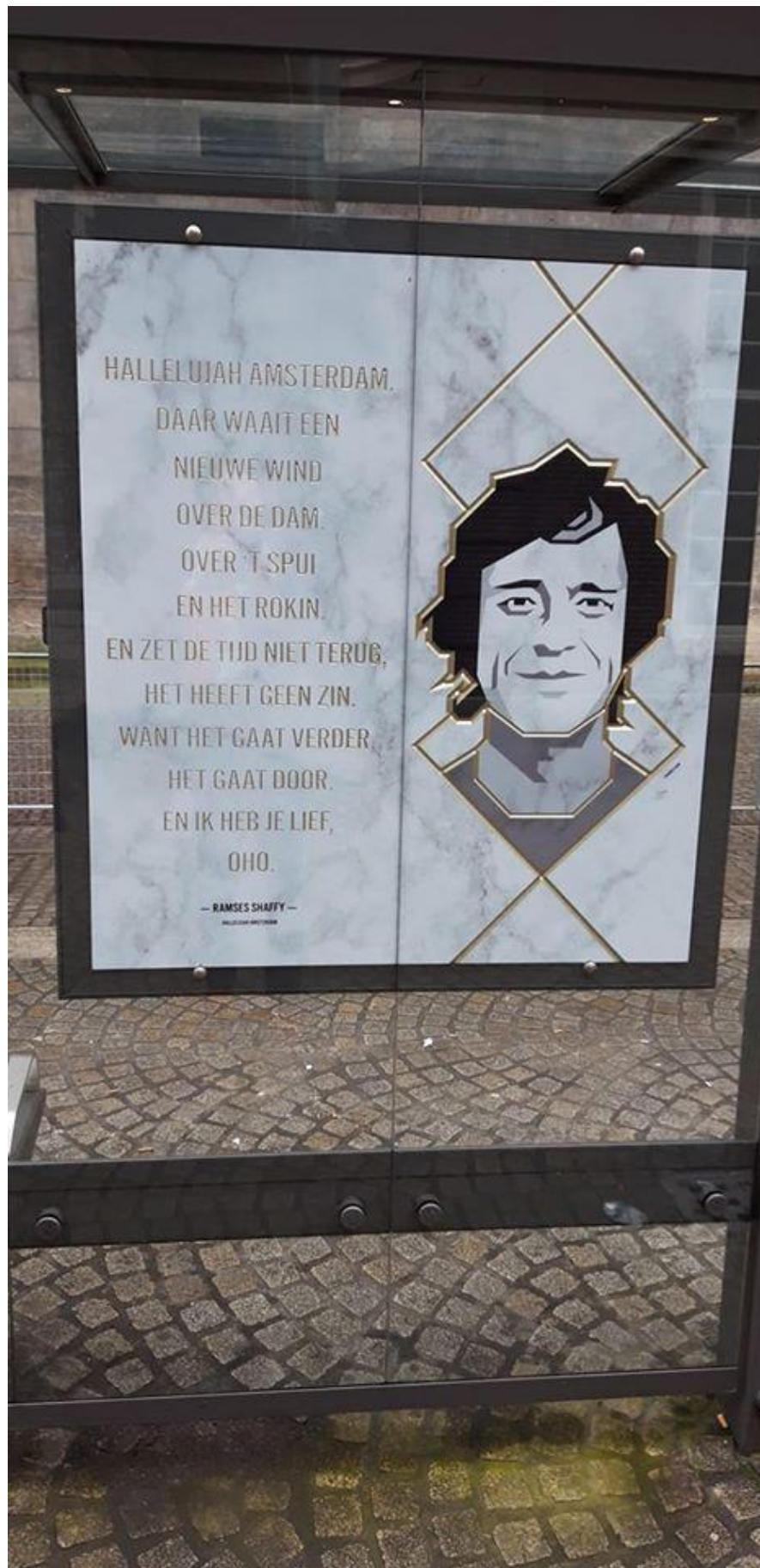
... en bij de tramhalte op de Dam.